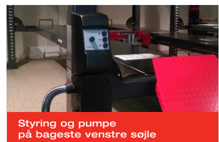
Styring og pumpe på bageste venstre søjle