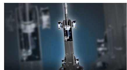
Løftestol med ruller