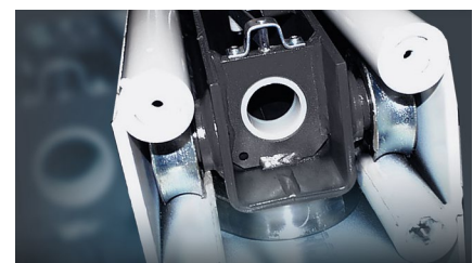
Stabil, svejst søjle