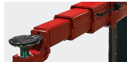
Trippel teleskopiske arme med F-konsoller